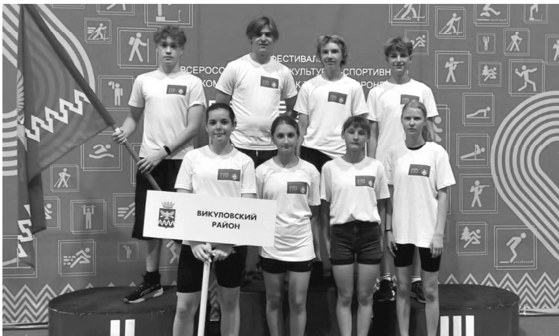
➤ Команда викуловских подростков

С 11 по 13 июля в г. Тюмени прошёл областной летний фестиваль Всероссийского физкультурно-спортивного комплекса «Готов к труду и обороне» (ГТО) среди обучающихся общеобразовательных организаций.