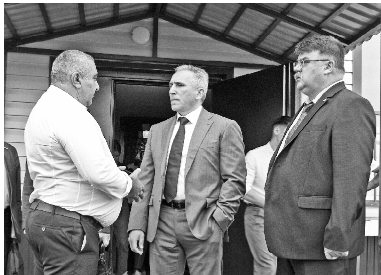
➤ Осмотр хода строительства многоквартирного дома