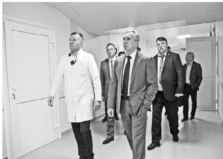
➤ В отремонтированном здании поликлиники

предназначен для отдельных категорий граждан: детей-сирот, переселения из ветхого и аварийного жилья, обеспечения жильём малоимущих граждан, стоящих на очереди. Всего в доме 47 жилых помещений, из них 46 – однокомнатные площадью от 28,4 до 42,3 кв. м и 1 – трёхкомнатная квартира общей площадью 59,7 кв. м. Квартиры планируются с чистой отделкой, санитарно-техничес-