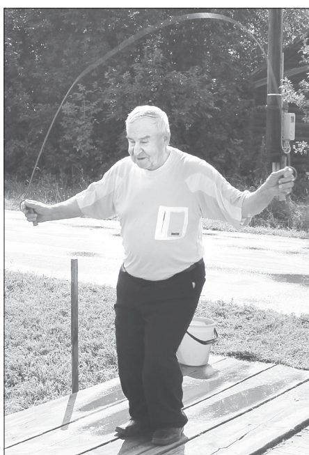
Жители Комаровки приготовили гостям не только угощения, но и задания. Например, прыгая на скакалке, назвать фамилии всех семей, которые проживают на этой улице