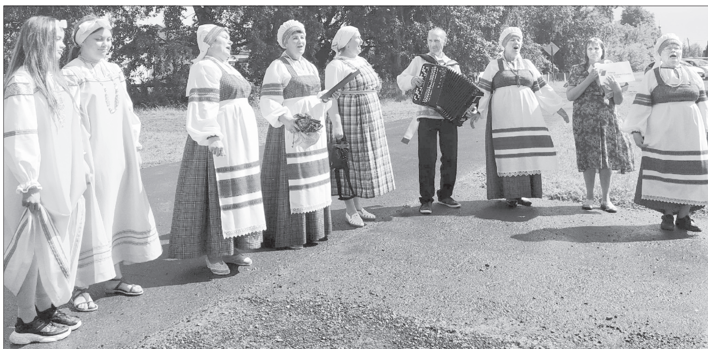
Без вокального этнографического коллектива «Зыряночка» не обходится ни один праздник в селе, да и в целом в Ялutorовском районе. Для земляков в этот день артисты приготовили концерт из десятка песен, которые исполнили на русском и зырянском языках