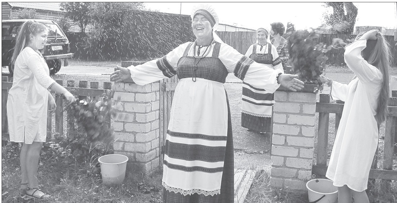
Обязательный атрибут праздника Ивана Купалы - берёзовый веник. С его помощью проводят обряд очищения от чар и грустных мыслей. Такой обычай окропления водой в жару особенно приятен