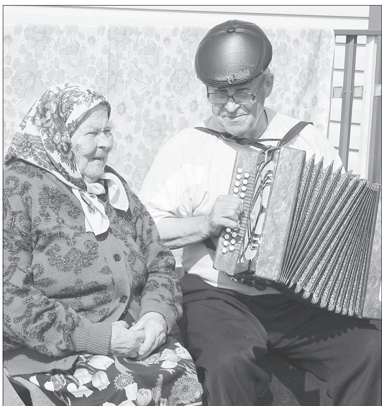
Это старинное село славится своими талантами. Поют здесь все - и стар и млад