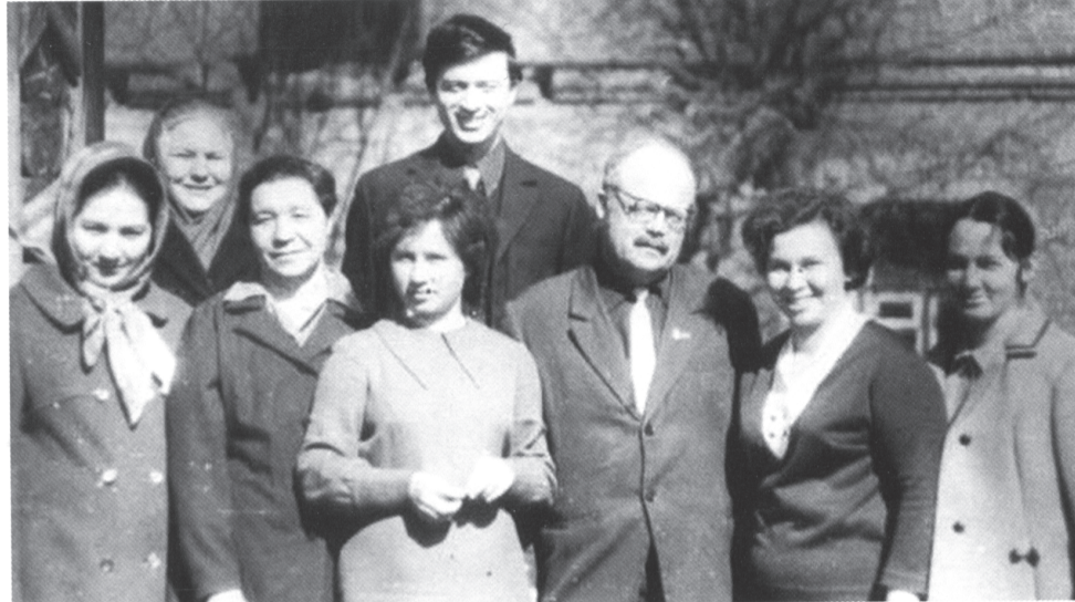
Коллектив «Советской Сибири» в 70-ые годы