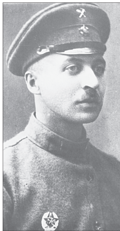
Руководитель военно-оперативного штаба Федор Масленников