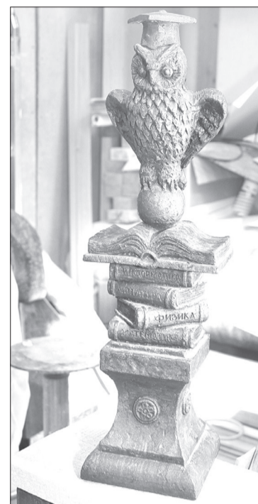
Нереализованный проект - соевком знаний

Мы же надеемся, что его творения найдут подобающее место в нашем городе. И труд его будет достойно оплачен.