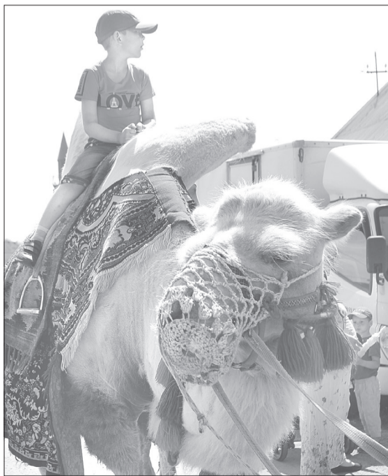
Верблюд на праздник прибыл из Тюмени