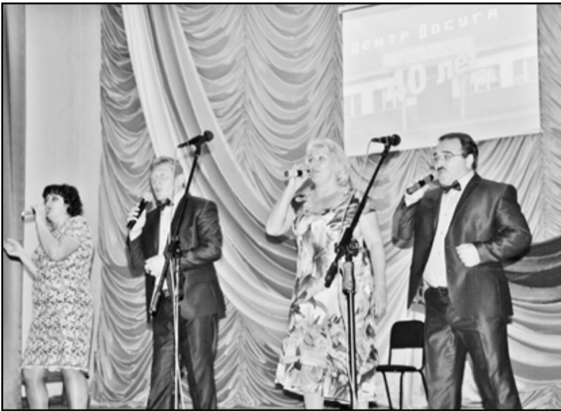
Нынешние артисты – успешный творческий коллектив, настоящая семья