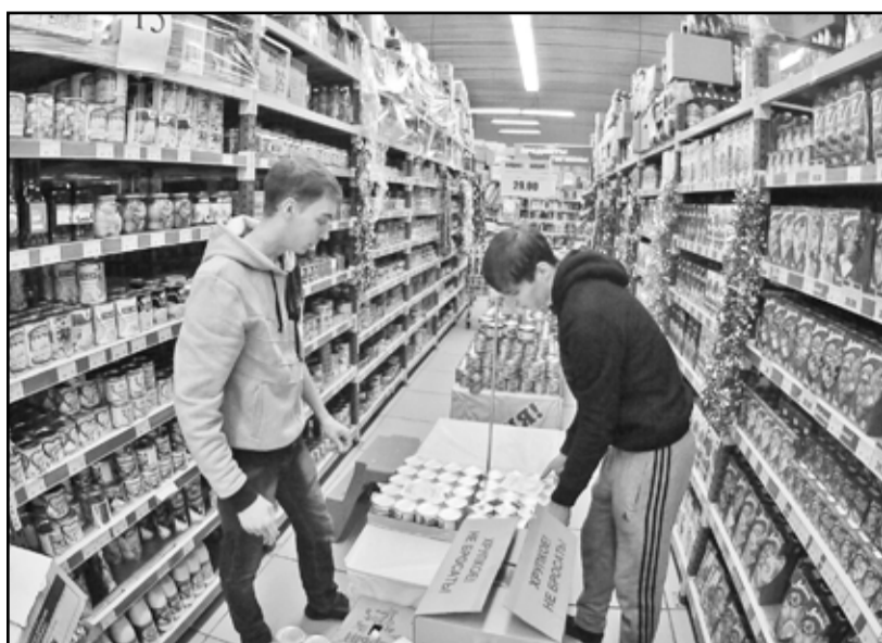
В «Низкоцене» все полки заставлены товаром

— Большим спросом пользуются сыры, произведённые ишимскими и алтайскими сыроделами, — сказала она.