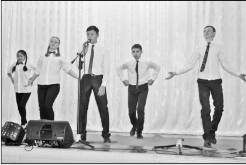
Выступает команда «БЭМС»

Хорошее настроение в тот день было у всех присутствующих в зале. Лица участников, их болельщиков и жюри светились улыбками. Второе место в конкурсе заня-