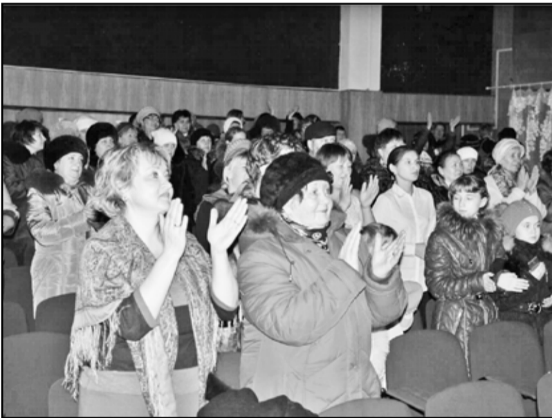
Без поддержки благодарного зрителя немислима творческая жизнь любого культурного учреждения

на стенды. История дома культуры – жизнь, молодость и гордость уже не одного поколения ильинцев. Рядом с фотографиями – исторический реквизит, костюмы, в которых работали на сцене участники народной самодеятельности. Догадываюсь, что практически все эти вещи выполнены их собственными руками и оттого особенно драгоценны, как и связанные с ними воспоминания.