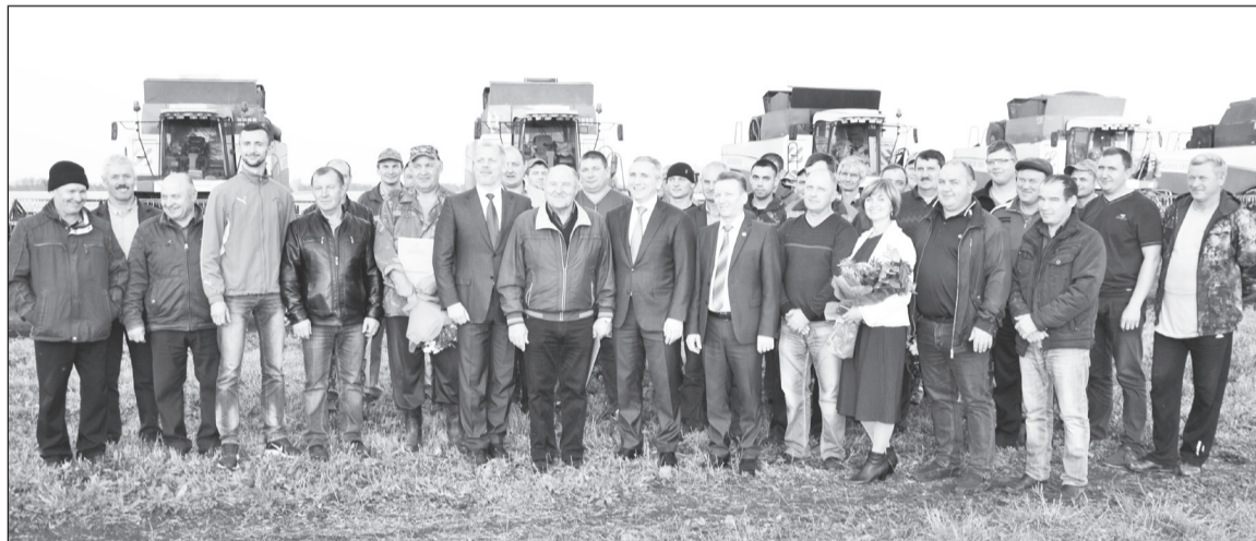
Коллективу «Нива-Агро» получить награды.