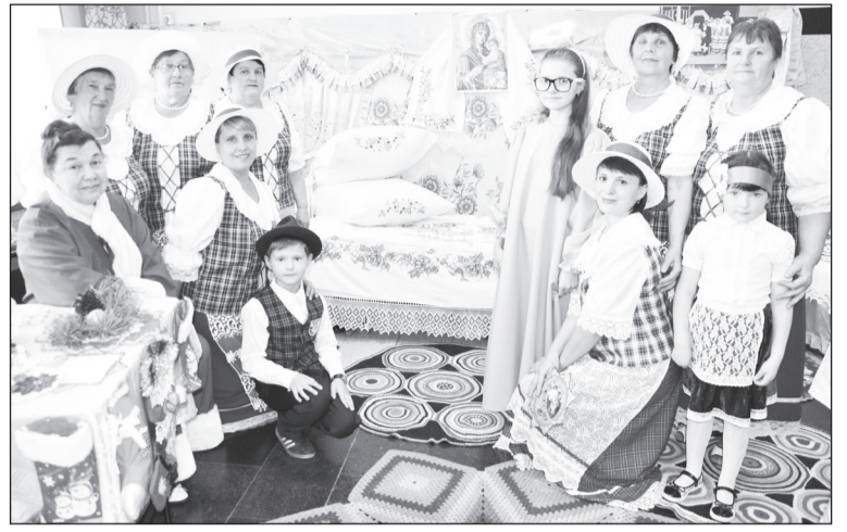
Победители фестиваля «Мост дружбы – 2018» – суерские немцы. Истории праздника традиционными костюмами.

Почти всегда большая часть поселенческих коллективов воссоздаёт русское подворье. В этом году его проиллюстрировали пятковцы – вязанием без спиц, видоновцы – блинами, а буньковцы – песнями. Емуртлинцы пели частушки у стола с самоваром, жители Скородумского поселения продемонстрировали обычаи наговоров на урожай, нижнеманайцы раскрасили своё выступление звуками гармони, а крашенинцы завлекали го-