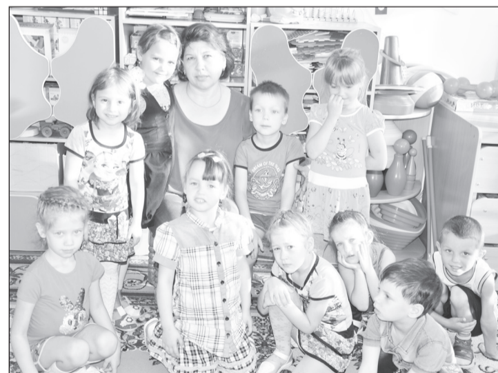
Малыши любят свою воспитательницу.