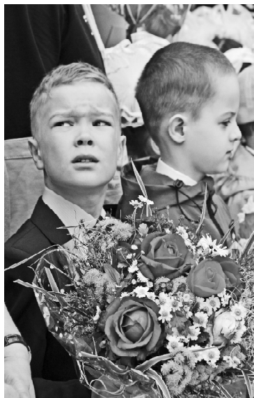
» На линейке в ВСОШ №2