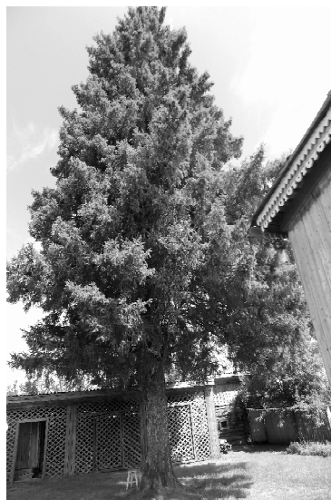
➤ Двухсотлетняя ель во дворе дома Валерия Ухалова