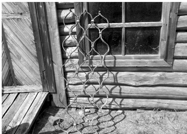
➤ Сохранившаяся решётка из окна Каргалинского храма