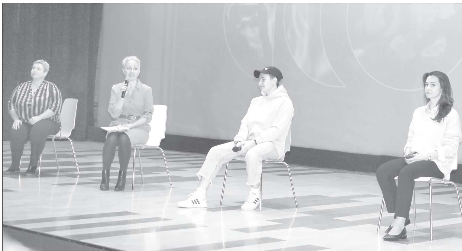
На встрече организаторы озвучили ребятам официальную статистику: в России с агрессией сталкиваются от 36 до 51% школьников

Подростки посмотрели кино на актуальную для их возраста тему буллинга