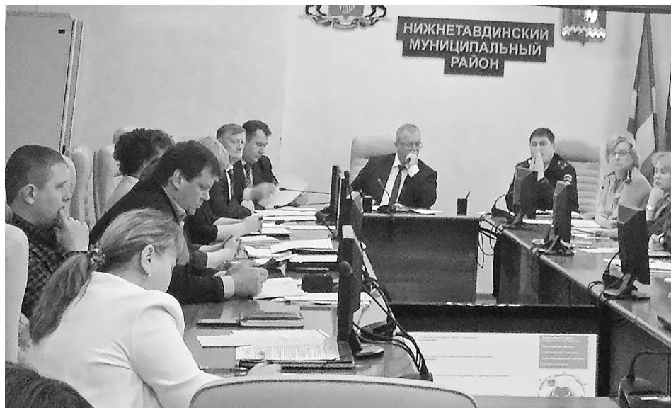
Работа совета по противодействию коррупции. Большой зал администрации Нижнетавдинского района.

О реализации мероприятий по противодействию коррупции в территориях района держали ответ главы Андрюшинского и Чугунаевского сельских по-