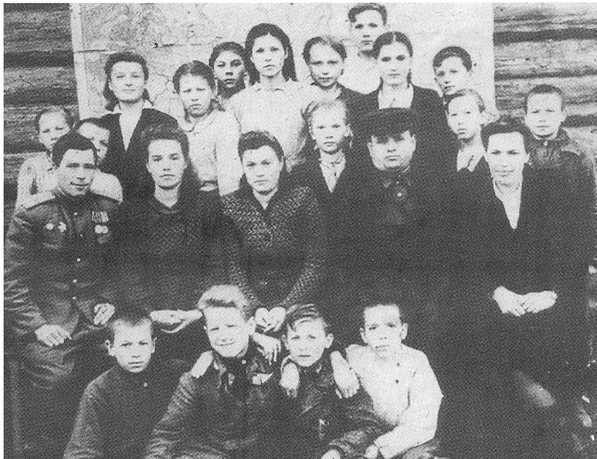
Учителя и ученики 6-го класса школы-семилетки, 1948 год.

Дальше – больше. Хуторок превращался в деревню, раз-