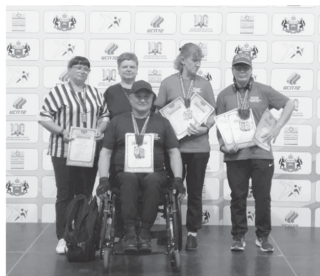
В копилке спортсменов Ярковского района – новые награды

Поздравляем ярковчан с отличными результатами, желаем нашей сборной новых достижений и побед, даль-