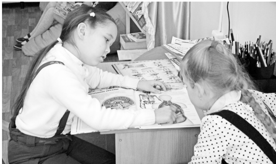
Детей привлекает в книге всё яркое, они любят картинки.

На сегодняшний день в детском отделе центральной районной библиотеки оформлена выставка «Волшебный мир сцены», посвящённая Году театра в России. Она будет ежеквартально обнов-