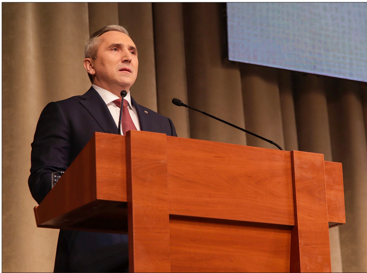
• Губернатор Тюменской области Александр Моор во второй раз обратился с Посланием к региональному парламенту и жителям региона.