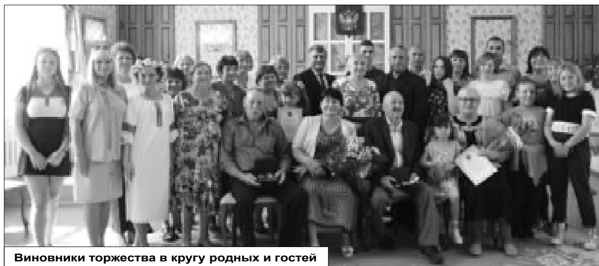
Виновники торжества в кругу родных и гостей