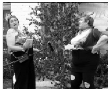
«Девочки-подростки» с улицы 50 лет Октября (правая сторона)

тельно готовят праздничные угощения и театрализованные выступления – «защиту проекта». Вот и этот праздник не стал исключением: в гости пришли Белоснежка и семь гномов, Водяной со своей свитой, красавица в «воздушном» белом костюме, старушки-веселушки, «девочки-подростки», «Дух леса», восточные красавицы, да еще и все герои сказки «Репка». Актёрами были люди всех возрастов, включая активных пенсионеров. Кстати, они тоже свой стол с разными вкусностями на суд жюри выставили и вместе со всеми представляли номера художественной самодеятельности.