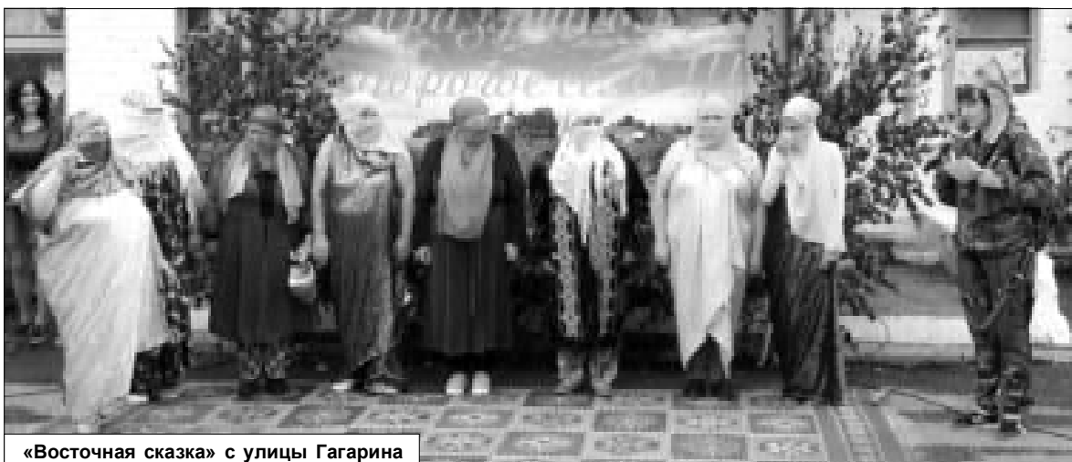
«Восточная сказка» с улицы Гагарина