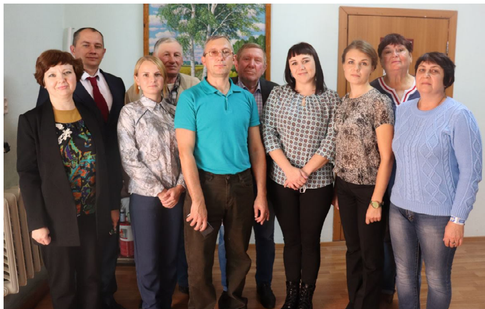
Депутаты ситниковской Думы настроены на плодотворную работу

После выступления кандидатов депутаты и приглашенные на заседание лица задавали вопросы и высказывали свое мнение.