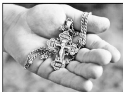
Крест даётся нам по силам

Евангелие говорит, что страдания Христа длились около шести часов. Чтобы ускорить казнь, стража или палачи нередко мечом перебивали голени распятому. Стражники, охранявшие Голгофу в день распятия Христа, торопились – по той