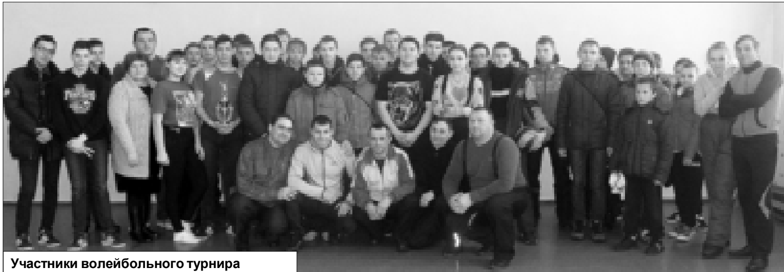
Участники волейбольного турнира