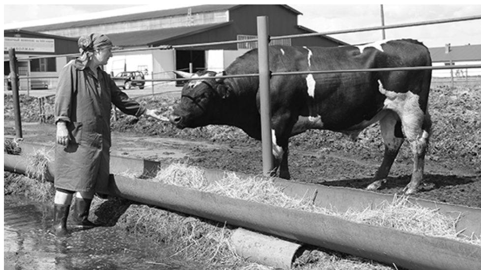
* Летние будни комплекса