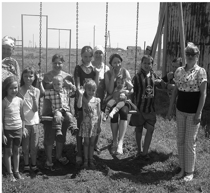
* В Кочкарном

В.А.Сухомлинский писал: «Детство – каждодневное открытие мира. Нужно, чтобы это открытие стало прежде всего познанием человека и Отечества. Чтобы в детский ум и сердце входила красота настоящего человека, величие и ни с чем несравнимая красота человечества».