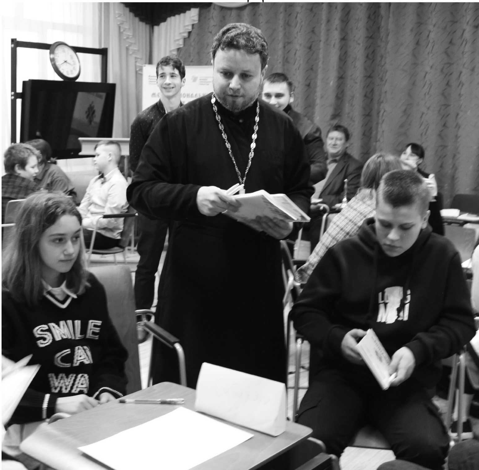
Школьники показали хорошие знания по истории и литературе