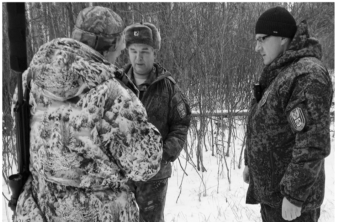
Инспекторы составляют административные протоколы на нарушителей правил охоты

Только за последнюю неделю ноября сотрудниками структурных подразделений департамента по охране, контролю и регулированию использования объектов животного мира и среды их обитания Тюменской области в результате проведённых мероприятий по патрулированию охотничьих угодий и иных территорий,