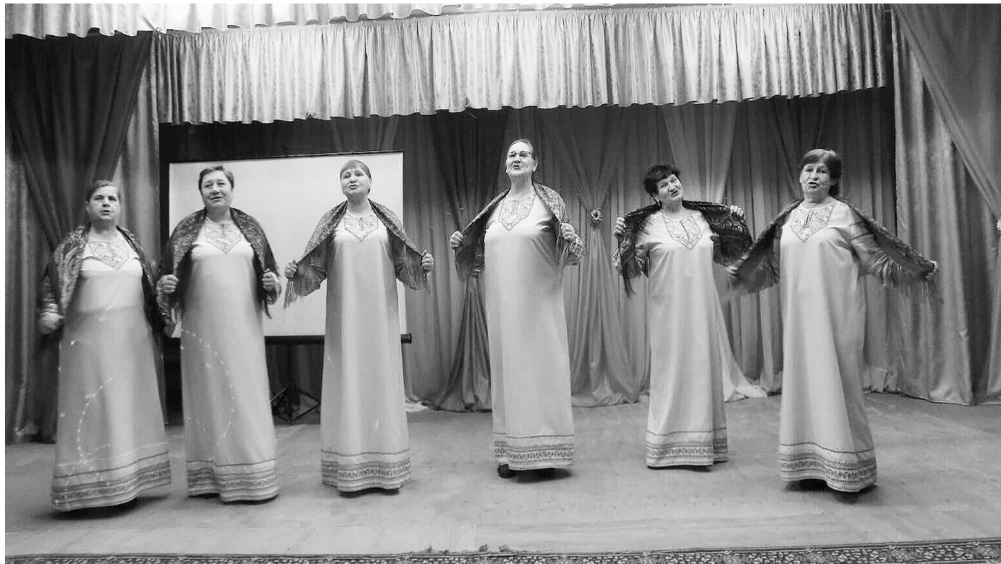
Творческий коллектив из Осиновки получил Диплом 3 степени

«Во всех номинациях много интересных, талантливых номеров,