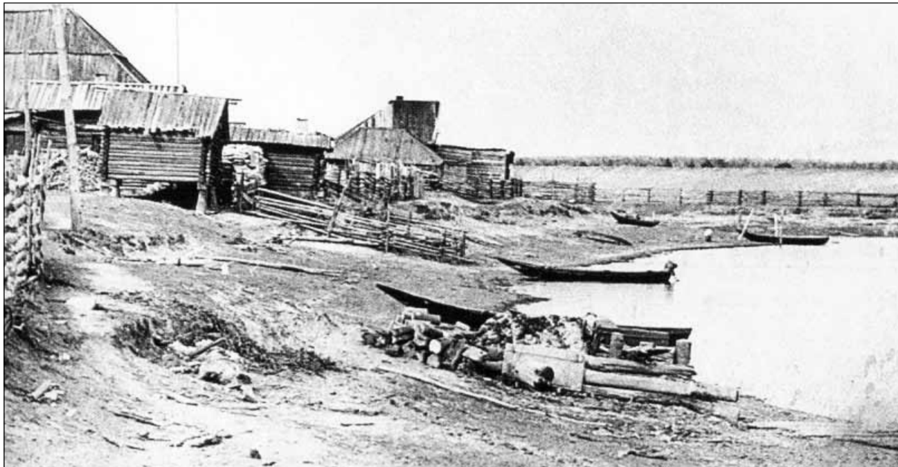
Деревня Берёзовка. Половодье на реке Вые. (1971).

- В разведку ходили, втыл, по языку. Ночь, темень! Я в траншею-то к немцам и завалился. Упал, куча тел подо мной вошкается. Я хрюнул кулаком-то раза два да, видимо, кончил кого-то. Один-то вроде стонет. Посветил фонариком - при чине, смотрю, фриц. Я выбросил его на бруствер да волоком к своим. А немец-то тот большим начальником