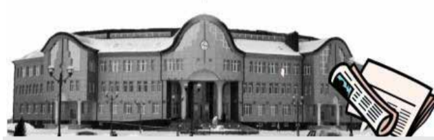
Администрация Уватского муниципального района

2 июня состоялось заседание Совета глав администраций муниципальных образований. На повестке было рассмотрено 6 вопросов.