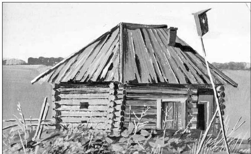
У реки. Деревня Сафьянка. Уватский район. (1991, бумага, гуашь).