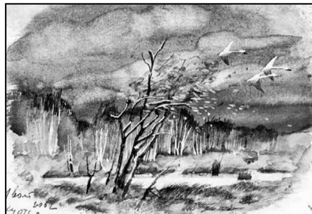
Уват. Кукуртыя. (2002).

Не было тогда колхоза беднее на целом свете, чем наш, имени Серго Орджоникидзе. Покося из года в год топливо водой. Скотину с лесной стороны драл зверь. И картошки-то государству недодавали, и репа не родилась. А об урожае зерновых и говорить не приходится! И народ-то у нас пил больше, чем другие. В районных сводках и соцсоревнованиях мы всегда красовались на последнем месте. И всё, что бы ни затеяли, - всё не как у людей. Задумали организовать свиноферму. Сви-