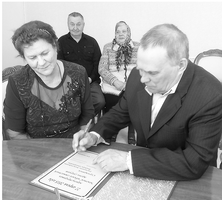
Счастливые юбиляры: супруги Курловичи и Сериковы (на втором плане).