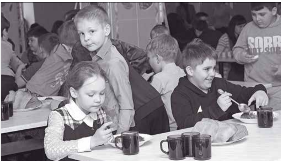
За питание школьников родители будут платить электронными деньгами. В эксперименте участвуют 13 классов из 11 школ района