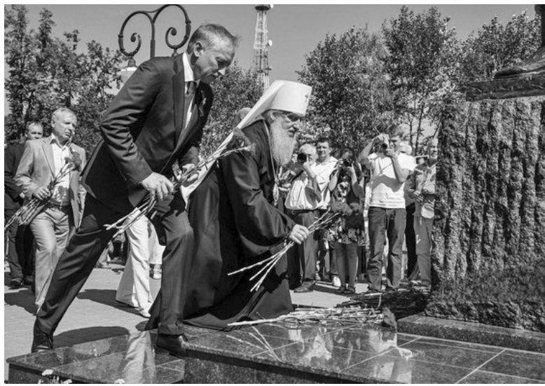
* Памятный монумент напомнит всем о тех, кто не вернулся из «горячих точек», выполняя свой профессиональный долг.