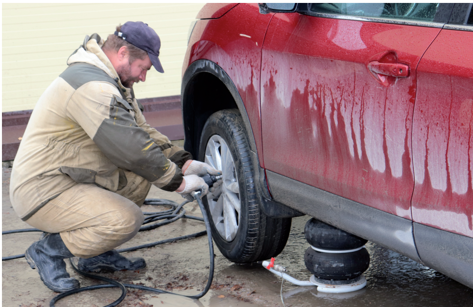
Главное - всё сделать вовремя.