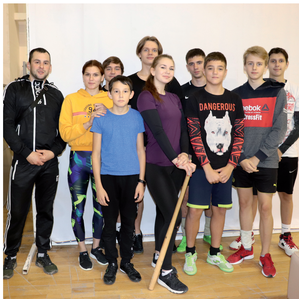
Дебютанты соревнований - команда из Мугена.