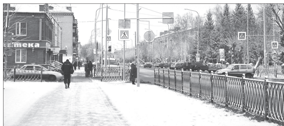
Эскизы ограждений отличаются.

Чем ближе к центру города, тем они сложнее