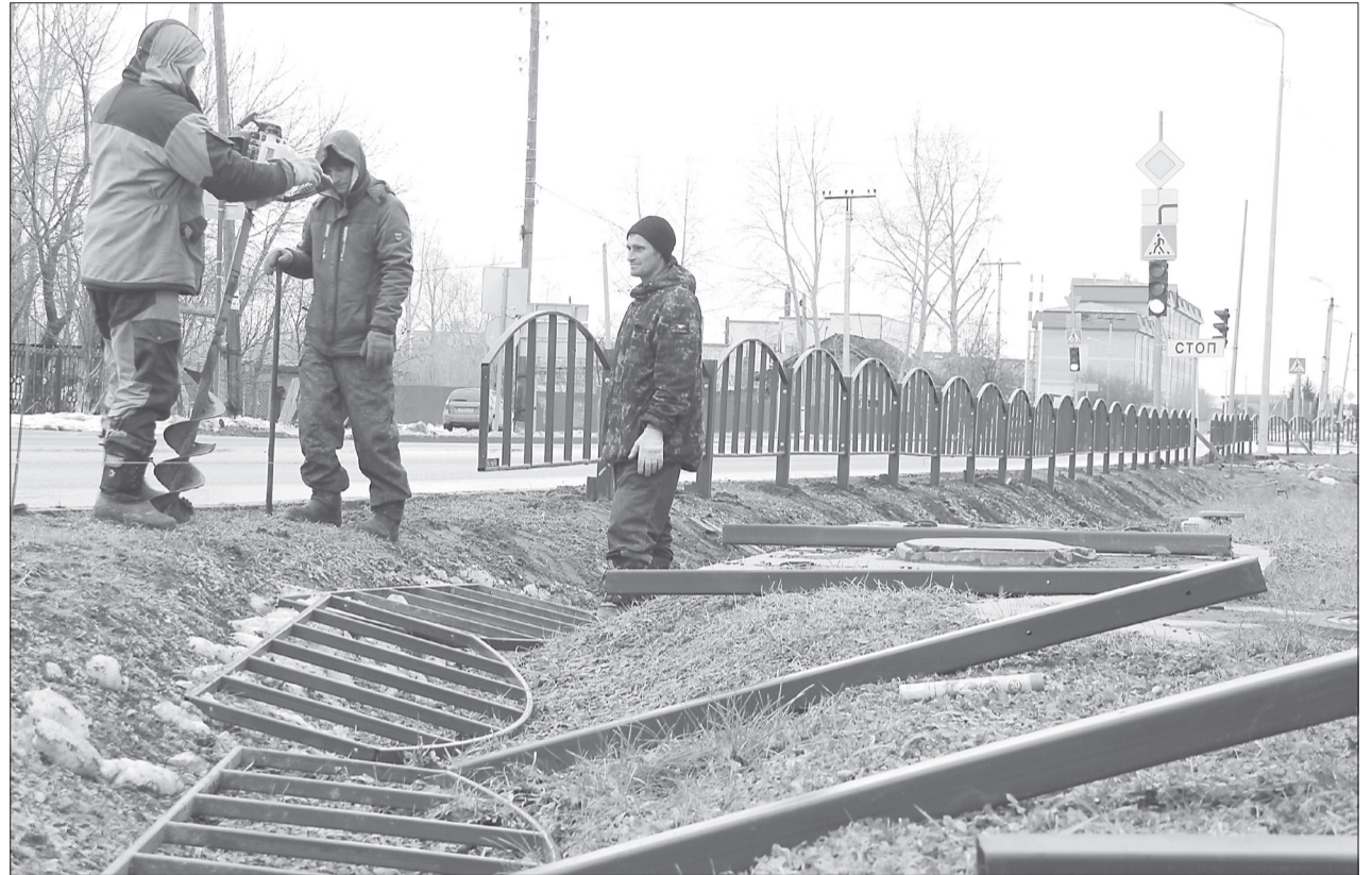
Рабочие устанавливают ограждения по согласованным схемам, но переделывать приходится многое

на декабрь - 80 руб., на I полугодие 2021 г. - 480 руб.