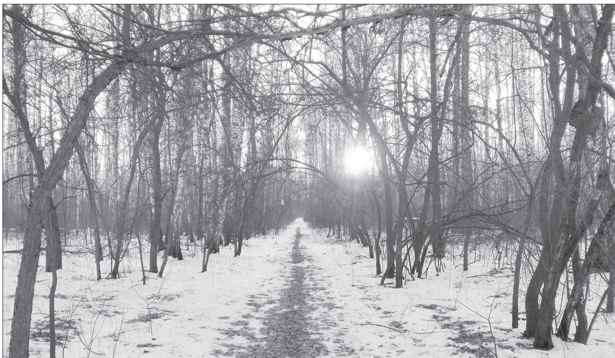
В роще немало аварийных деревьев, от падения которых могут пострадать горожане

Молодёжью официально предлагают называть людей в возрасте от 14 до 35 лет. Это повлияет на определения таких статусов, как «молодая семья» или «молодёжные общественные объединения». Новый закон увеличит и статистическое количество молодого населения в стране более чем на треть - до сорока одного миллиона человек, и соответственно расширит базу получателей господдержки. После доработок его готовы согласовать все фракции Государственной думы. В Общественной палате при этом отмечают, что возникает путаница статусов детей в Семейном кодексе как «лиц, не достигших 18 лет» и молодёжи в предлагаемом новом федеральном законе.