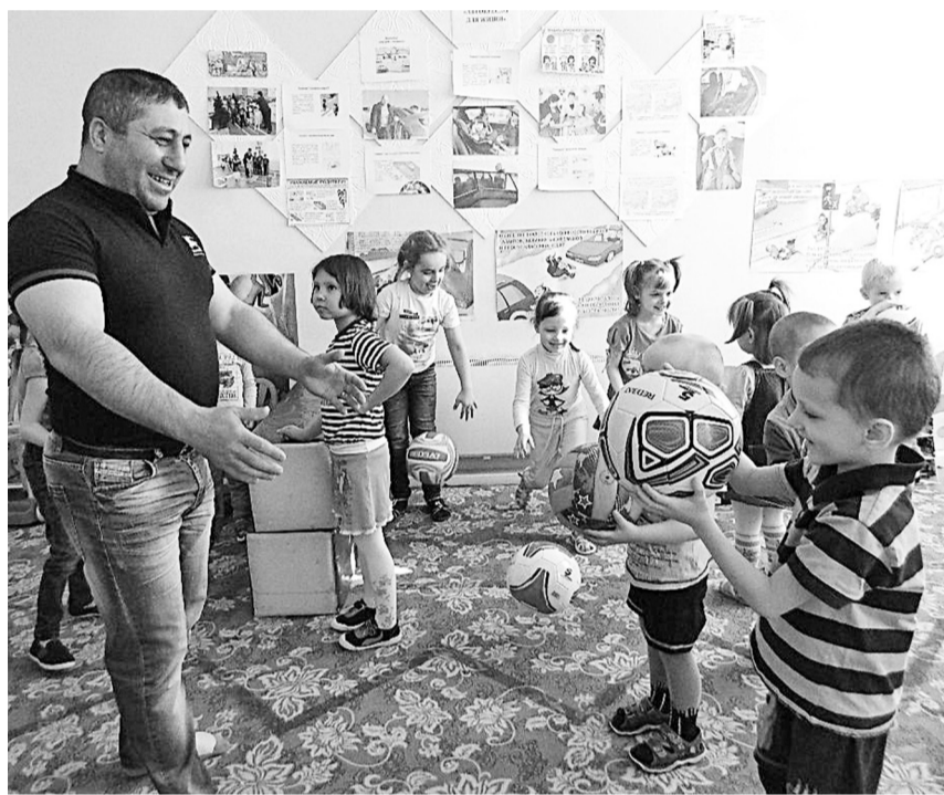
Мяч для детей – предмет первой необходимости.