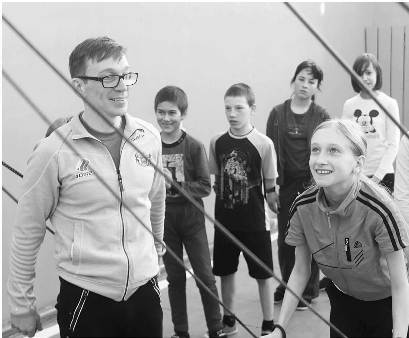
Паралимпийский чемпион Николай Полухин показывает учащимся Андрюшинской школы специальные упражнения на «резине».