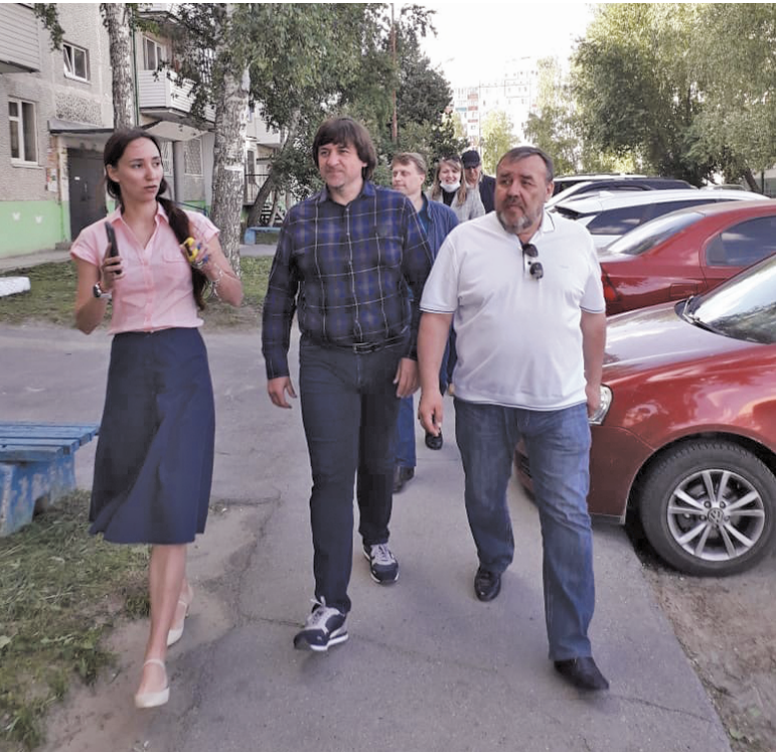
От дома к дому пешим ходом

Ситуация меняется к лучшему, потому что изменились требования при проведении конкурсов, что поставило объективные заслоны подрядчикам, которые не в состоянии выполнить условия, которые предъявляет фонд, администрация города и сами собственники к качеству выполнения работ, – подчеркнул глава города.