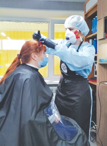
Мастера работают в специальных костюмах

Но чтобы возобновить свою деятельность, предприниматели обя-