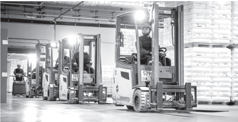
Открывшееся производство закрывает треть потребностей «СИБУР Тобольска» в поддонах