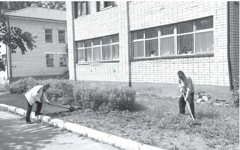
Разбить цветник – радость

– Прежде всего здоровья. Ну и, конечно, неиссякаемого энтузиазма, чтобы работа была в радость были видны её результаты и чтобы радостью и оптимизмом мы заряжали наших клиентов и подопечных.