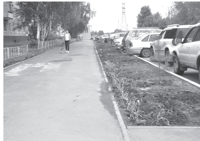
Аллея Победы быть

– Все наши совместные усилия направлены на то, чтобы обеспечить тоболякам комфортную и безопасную жизнь, – говорит народный избранник. – В програм-