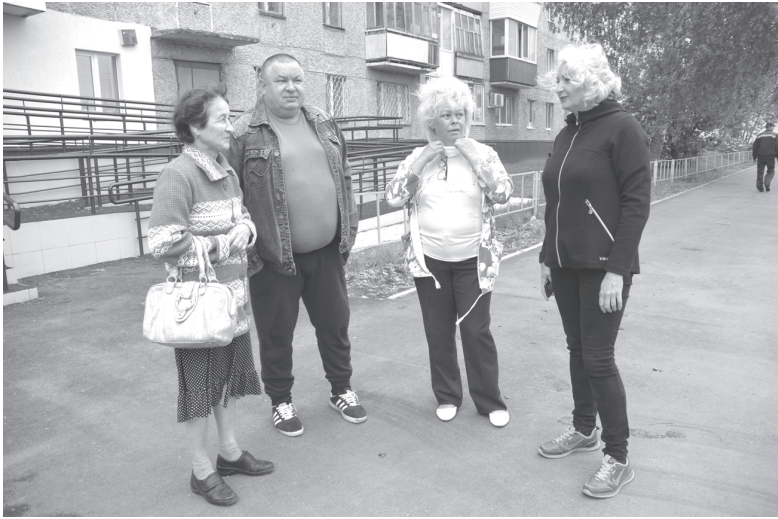
Все вопросы решаются сообща

слушивается депутат к жалобам, пожеланиям жителей 7 «а» микрорайона, не оставляя без внимания их наказы. Но, пожалуй, самое главное – она умеет разбудить жителей, настроить их на волну гражданской активности, доказать им на деле, что многое зависит от них самих, от их позиции. И потому неудивительно, что придомовые территории в 7 «а» микрорайоне – одни из самых благоустроенных и привлекательных в Тобольске.