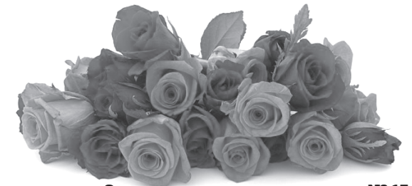
С уважением, коллектив школы № 13, учащиеся и их родители

Нашему директору – большая благодарность За вашу честность, прямоту, а также за лояльность, За труд нелёгкий каждый день, за школьную работу И за порядок, за ремонт и общую заботу! Желаем вам иметь успех, любовь и уважение, Здоровья крепкого всегда, огромного терпенья, Богатых спонсоров привлечь и коллектив хороший, И с каждым годом быть сильней, красивей и моложе!