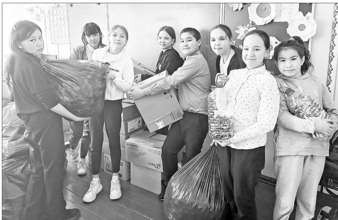
■ Ребята из Тарманской школы оказались самыми трудолюбивыми. Они собрали больше всего бумаги и батареек.

В акции «Сдай макулатуру - спаси дерево» среди комплектных школ победила Нижнетавдинская, а среди малокомплектных - Тарманская. Нижнетавдинские школьники собрали больше всего батареек в своей категории. А среди ма-