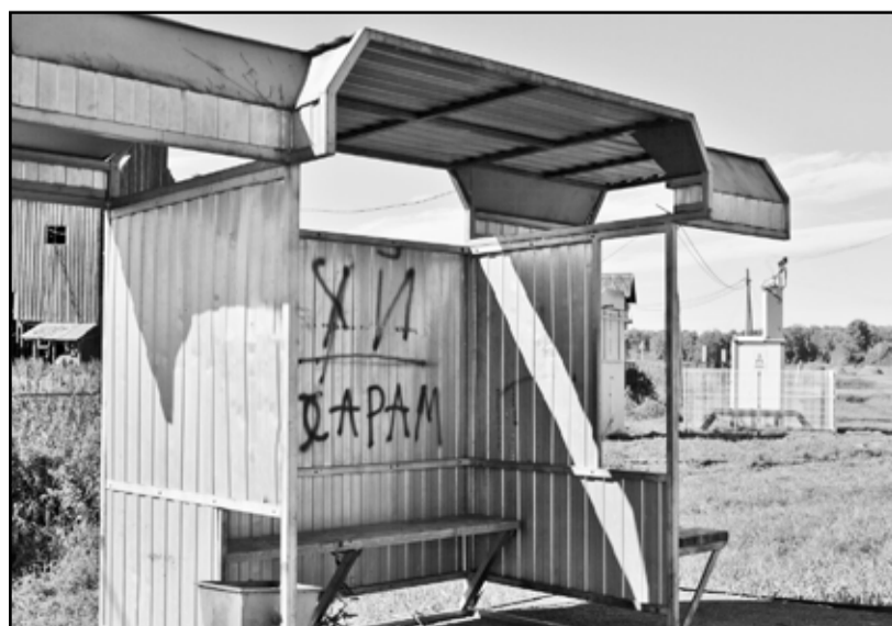
Остановка в Яровском стала негласным филиалом досугового центра

А в ночь на 13 августа, видимо, была особая «конкурсная программа», вероятно «пробой пера» назы-