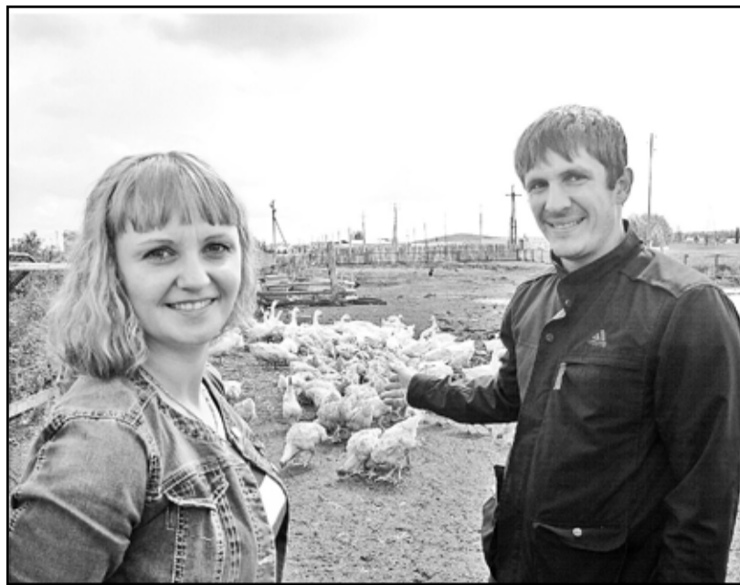
Не ленись и будет в радость жизнь

Но Альдиевы не унывают. Напротив, они полны оптимизма. Осенью они планируют пустить птицу в реализацию. На гусей особь спрос, они поедут в Тюмень.