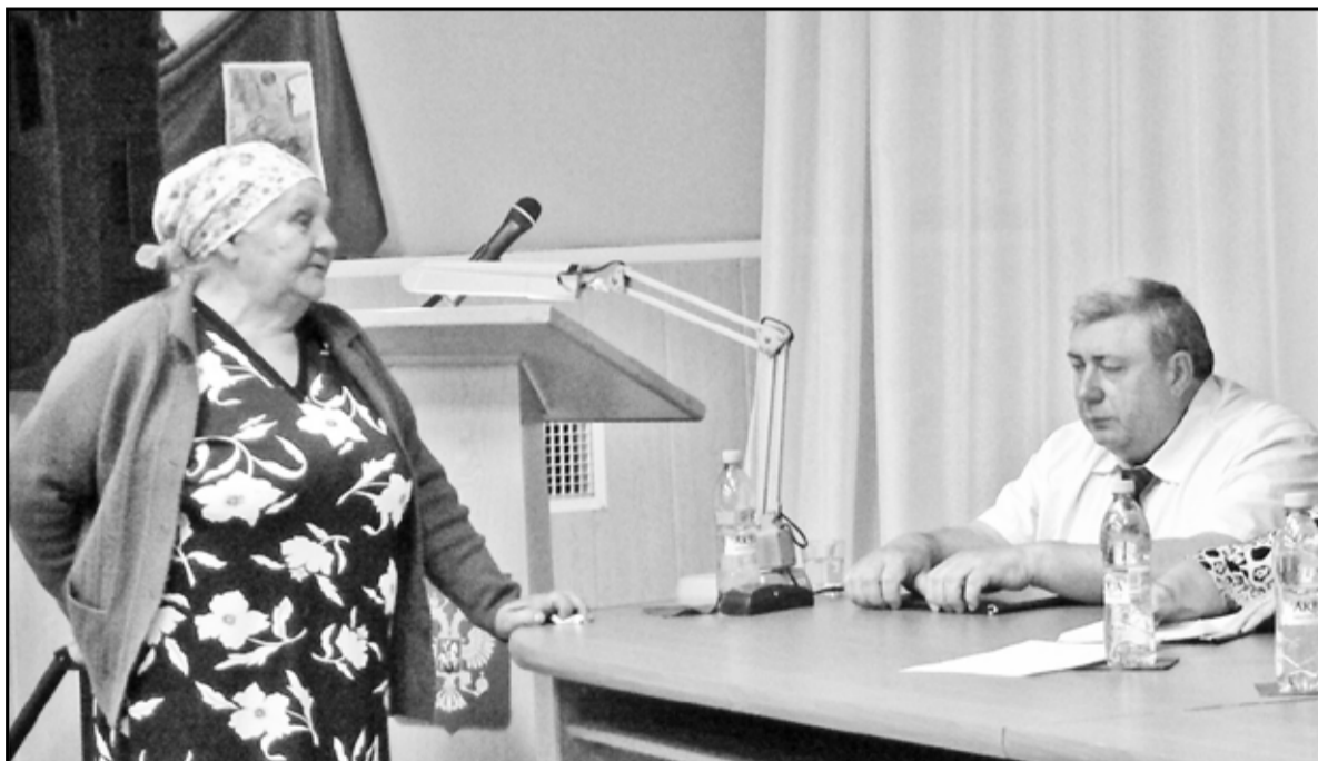
Вопрос задаётся открыто и прямо

Что касается качества питьевой воды, о чём с возмущением говорилось на встрече, то в летний период, во время подготовки к зиме, идёт ремонт водопроводных сетей. Их протяжённость в районе порядка 250 ки-