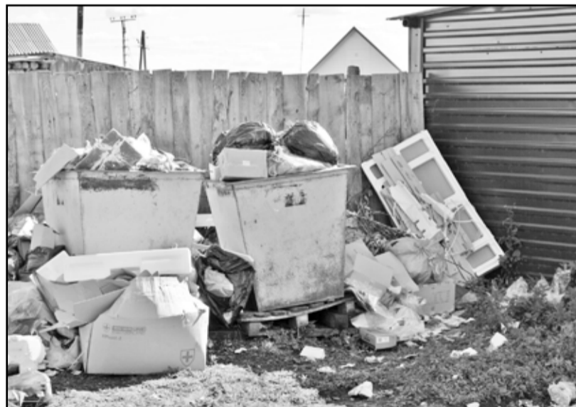
Мусорные баки стали объектом всеобщего пользования

как говорится, не вор. Такие доказательства имеются: видеоредакторы ведут круглосуточное наблюдение. Лица халявщиков запечатлены в афас и профиль.