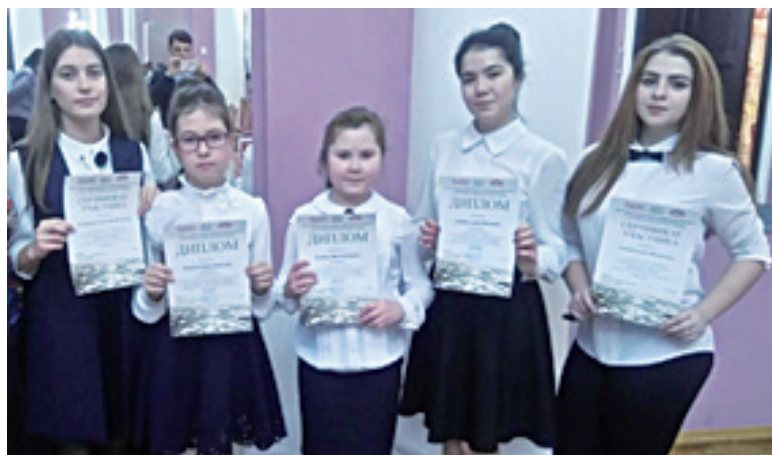
Научно-практическая конференция «Мы живём в Сибири»

В памяти моей мамы он остался молчаливым человеком,