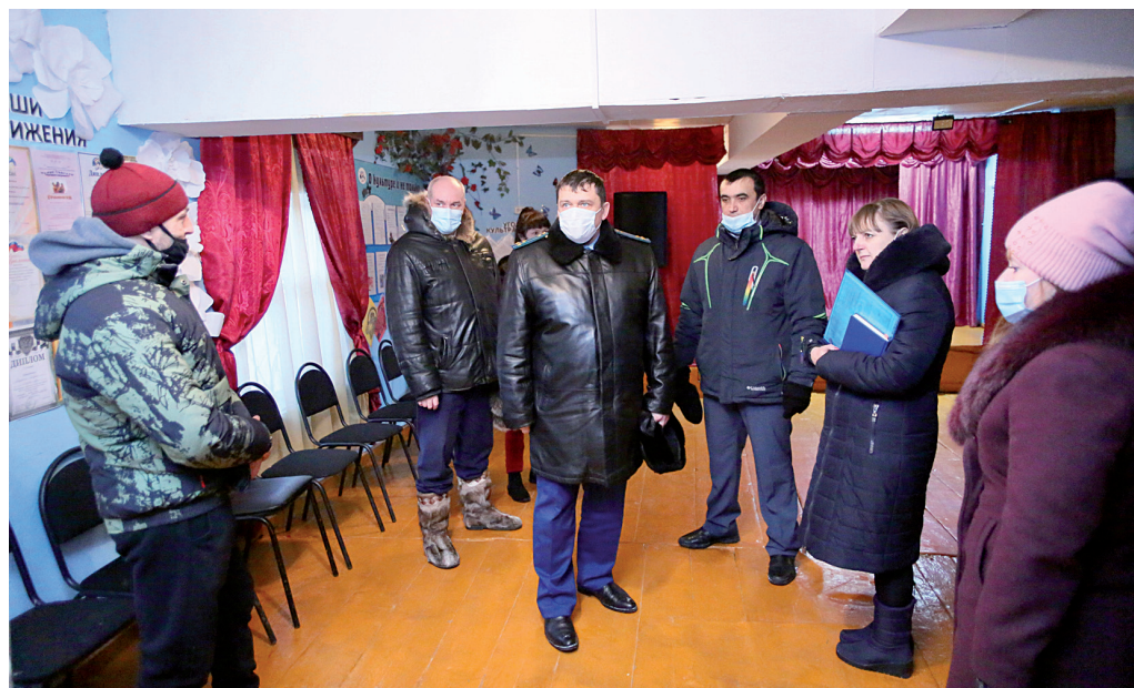
Межрайонный прокурор и глава района посетили сельский клуб, где убедились, что его состояние ожидает лучших времён