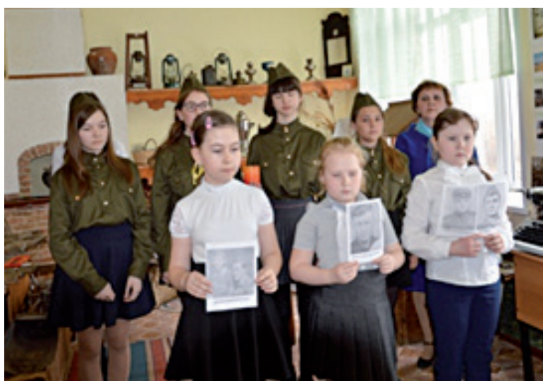
Экскурсия «Солдаты победы»

Эх, путь-дорожка фронтовая. Несмотря на то, что в феврале 1942 года моего прадеда назначили заведующим военным отделом Уватского ВКП (б), он не мог оставаться в тылу. Как и другие, рвался на фронт. И через год добился своего – стал командиром стрелкового взвода 133-й стрелковой дивизии, которая участвовала в прорыве блокады Ленинграда, в ликвидации фашистских войск под Сталингра-