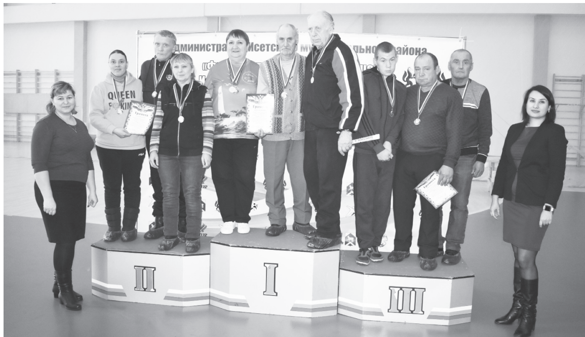
|| Призёры соревнований по бочке.

В бочке в тройку призёров вошла команда Слободобешкинского поселения, второе место взяли шороховцы, первое заняли мининцы.