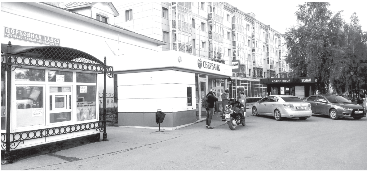
Киоски на остановках теперь вне закона

Не только к внешнему виду киосков сегодня предъявляют строгие требования, но и к их тройной безопасности – пожарной, санитарно-гигиенической и даже дорожной. Если с первыми двумя нормами безопасности более-менее понятно – ларьки должны быть только из противопожарных материалов, находиться не ближе 15 метров от жилых домов и капитальных строений, при продаже продуктов питания должен соблюдаться целый список санитарных требований (что большая редкость для наших киосков с шаурмой), то при чём здесь дорожная безопасность, разберёмся подробнее.