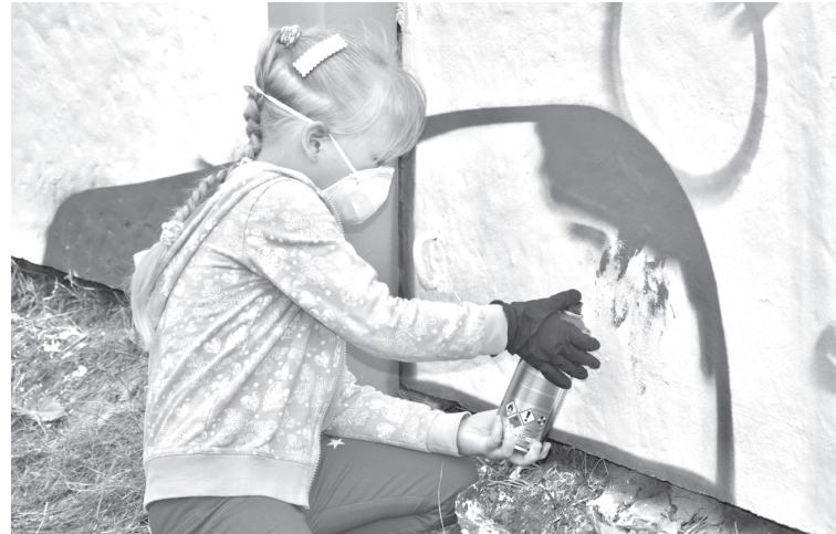
Горожане сами расскажут истории для эскизов

В Тобольске стартовал приём заявок на фестиваль стрит-арта «Вектор улиц. Районы, кварталы».