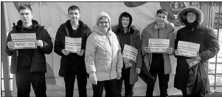
Ребята из Мальково познакомились с процедурой голосования.

Ольга БОРОВИКОВА.