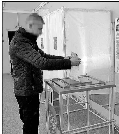
Голосует участник СВО, приехавший в отпуск в п. Московский.