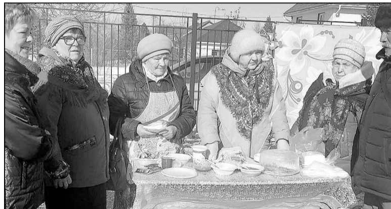
Ветераны села Луговое.

построить! Сегодня Россия вошла в эпоху героев. А героизм всегда начинается с выбора.