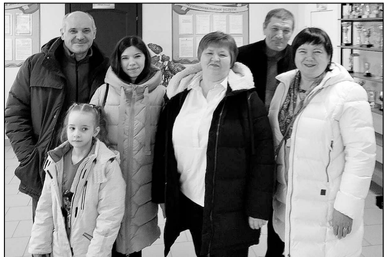
Богандинский голосует семьями.