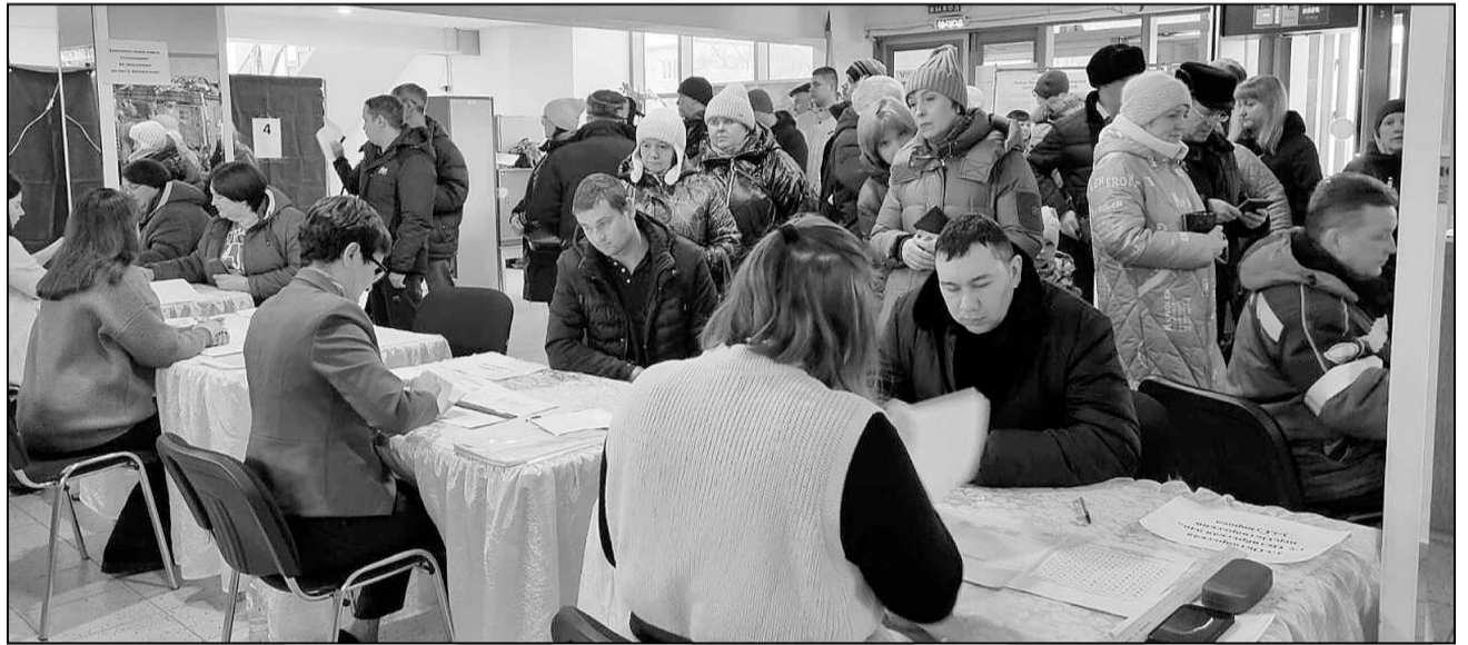
На избирательном участке в поселке Боровский. 15 марта, 8 часов утра.