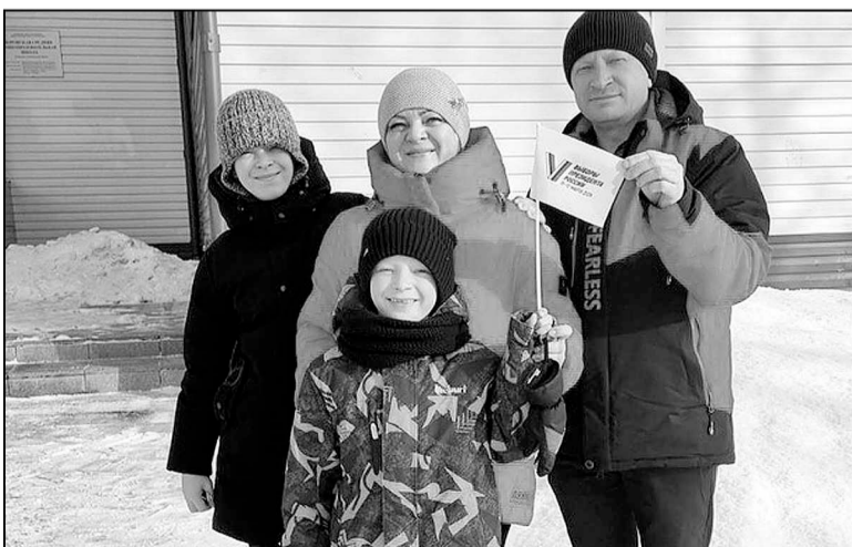
Сотрудники администрации поселка пришли на избирательный участок семьями.