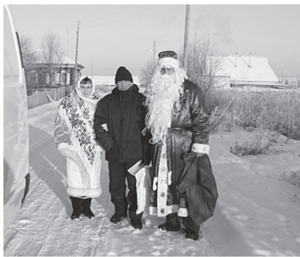
Дед Мороз и Снегурочка – в гостях у жителей деревни Желнина.

– С поздравлениями мы ездим с 11 декабря. За это время объехали 16 малых деревень, не имеющих