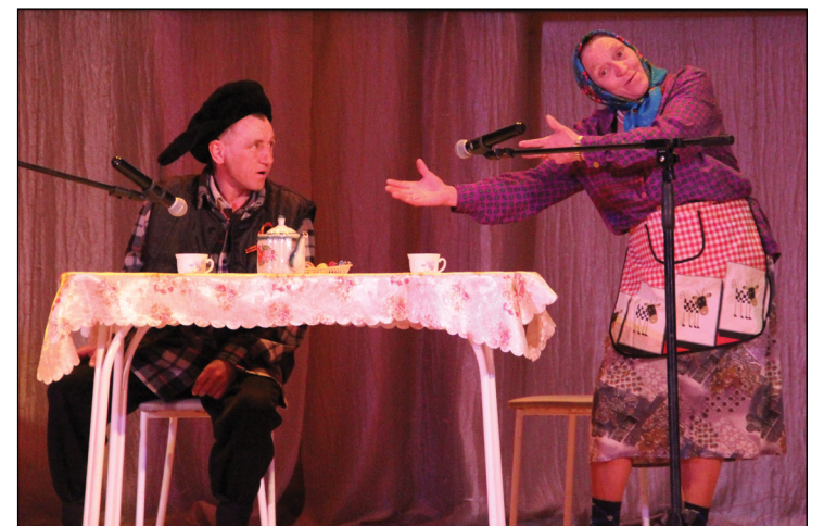
• Супруги Шефер из Малоскарёдного рассмешили зрителей историей о брачном контракте.

Статуэтками районного фестиваля «Аромашевские зори», посвящённого 95-летию со дня образования Аромашевского района, были награждены все участники. Каждый артист получил памятный приз согласно своей номинации. Благодаря этому концерту фонд помощи ветеранам пополнился более чем на 12 тысяч рублей. А в заключение концертной программы глава района поблагодарил артистов за подаренный праздник и хорошее настроение.