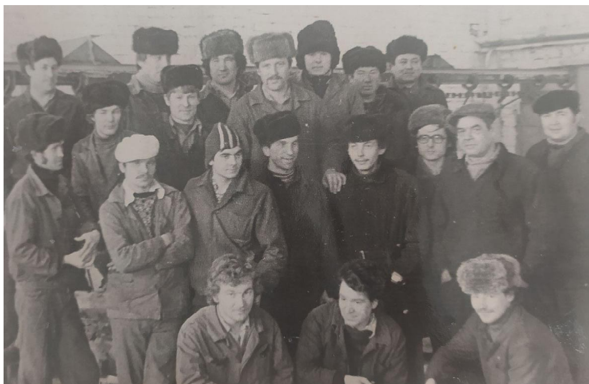
Рабочие бригады моторного участка по ремонту автодвигателей, 1982 г.