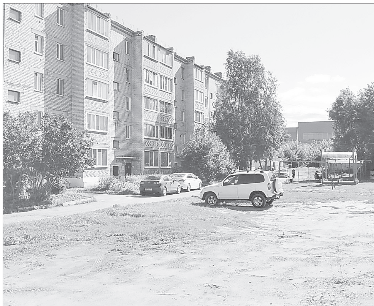
Территория у дома 185 на ул. Свободы большая и нуждается в благоустройстве