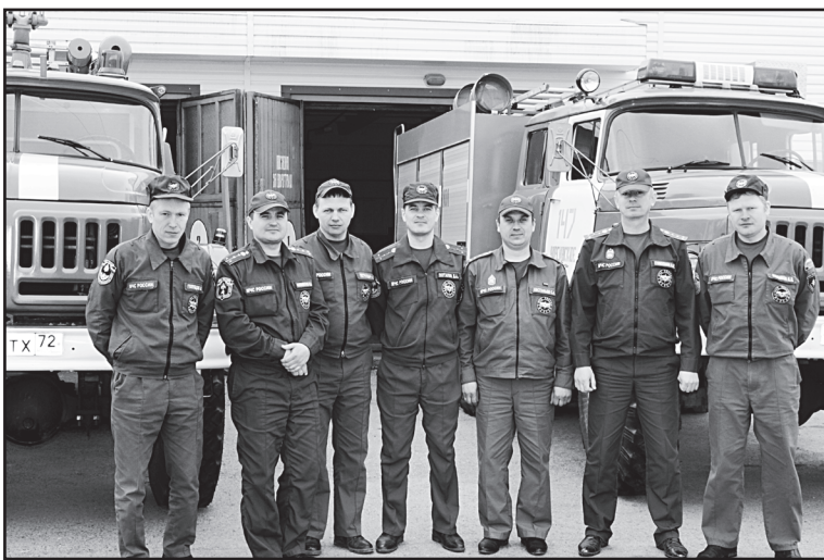
С профессиональным праздником!

А ещё в работе пожарного важна спортивная подготовка. Каждый сотрудник МЧС должен быть в отличной физической форме. Вес боевого обмундирования – около пяти килограммов, противогаз с баллоном со сжатым воздухом – это ещё около десяти, ремень с пожарным топором, шанцевый инструмент в виде лома, верёвки... Набирается до