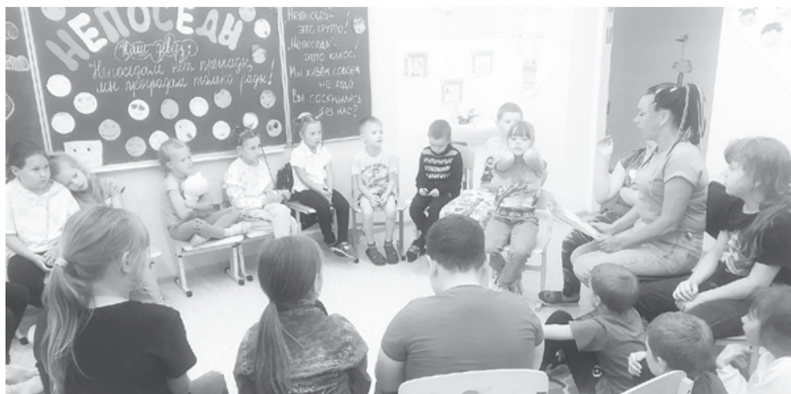
|| Фото из архива верхнебешкильской школы

На протяжении смены ведётся работа по развитию творческих способностей детей: ярмарка идей и предложений, конкурсы рисунков, загадки, ребусы, викторины. Уделяется внимание патриотическому воспитанию.