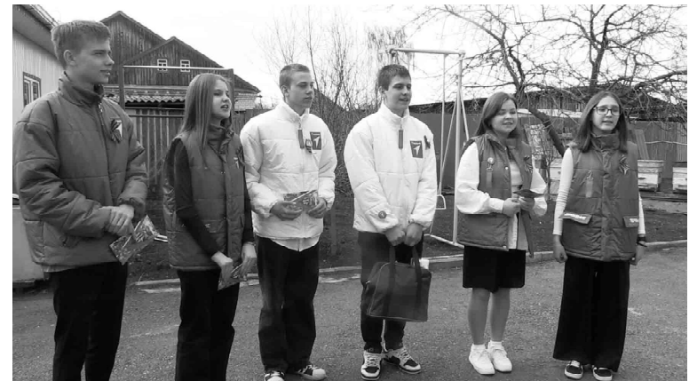
Активисты Движения Первых побывали с поздравительными визитами у тружеников тыла