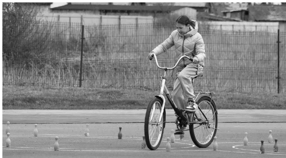
Ребятам необходимо продемонстрировать виртуозную езду: выполнить «змейку» и не сбить ни одной фишки