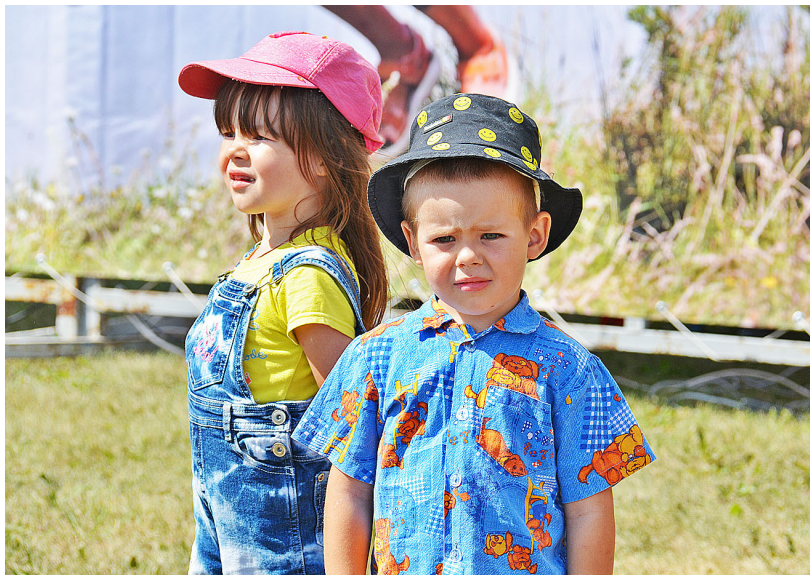
Маленькие участники дня здоровья

Информация предоставлена информационным центром правительства Тюменской области