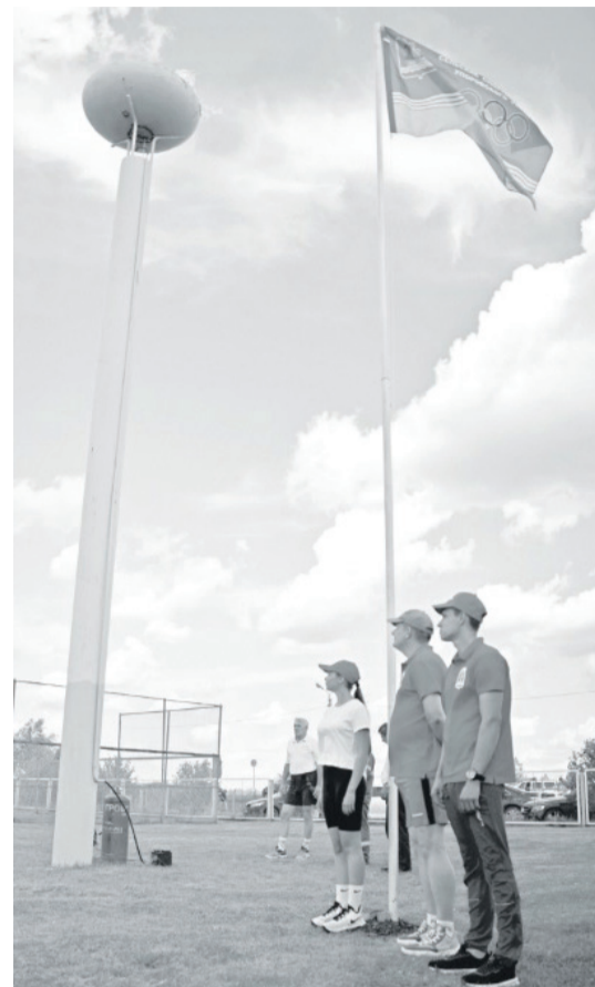
Флаг игр поднят, пламя зажжено.