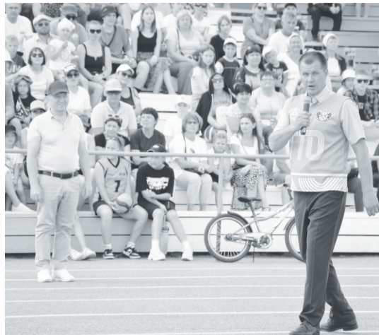
На торжественном открытии парада.

В Упорово подведены итоги юбилейных районных сельских спортивных игр