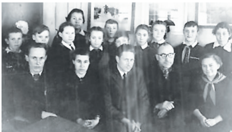
Учителя и ученики Суерской школы. 1961 год.

Подготовила к печати Лидия АЛЕКСАНДРОВА.