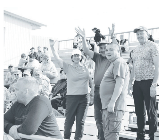
Болельщики активно поддерживали своих фаворитов.

Вера ЛИПУХИНА, Дмитрий СОРОКИН. Фото авторов.