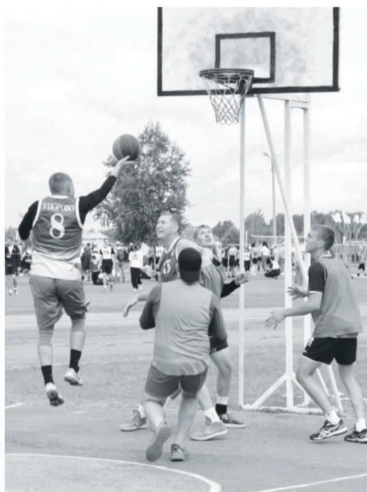
Напряжённое противостояние спортсменов из Упорово и Суерки.