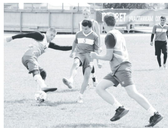
Ингалинцам в матче пришлось нелегко.