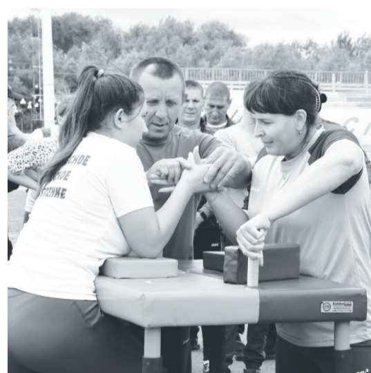
Судья корректирует захват соперников.