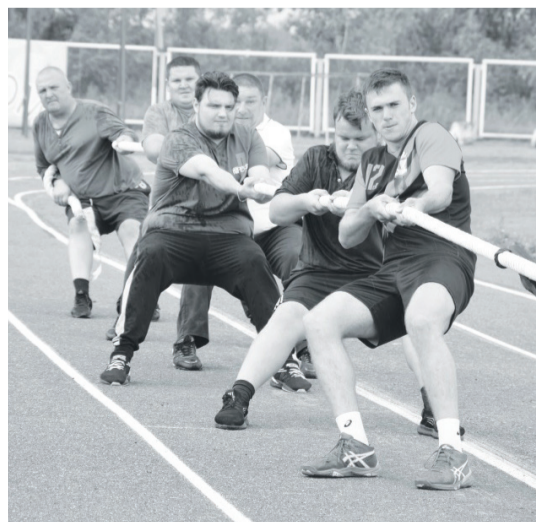
Победители соревнований по перетягиванию каната.

В райцентре в прошедшие выходные состоялись главные спортивные состязания года. На стадионе «Центральный» определены победители и призёры игр по 13 видам спорта.