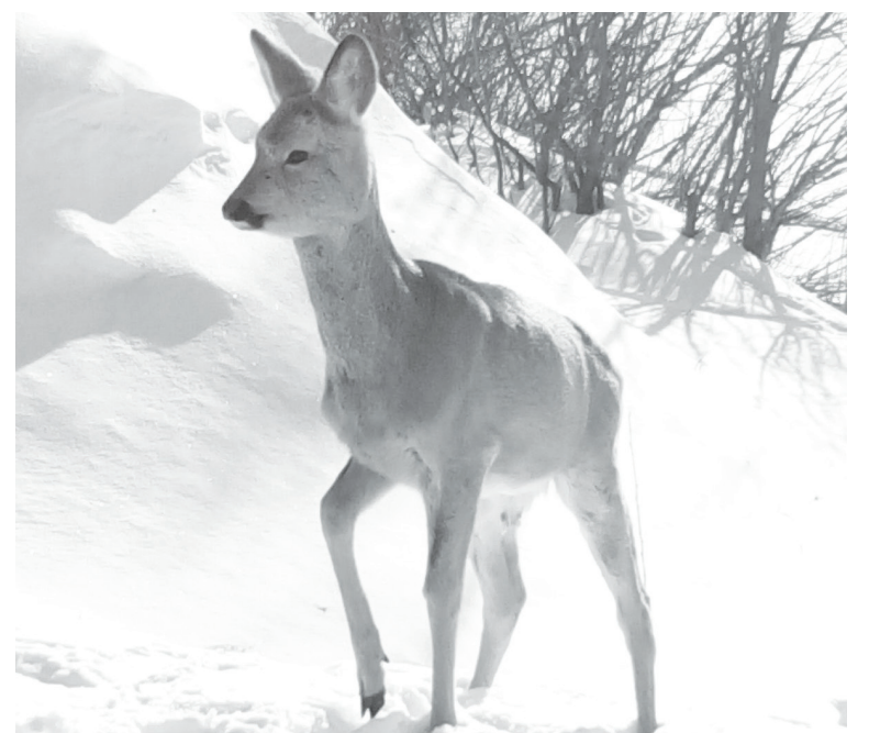
Благодаря проекту чернаковские дети делают по-настоящему уникальные кадры.