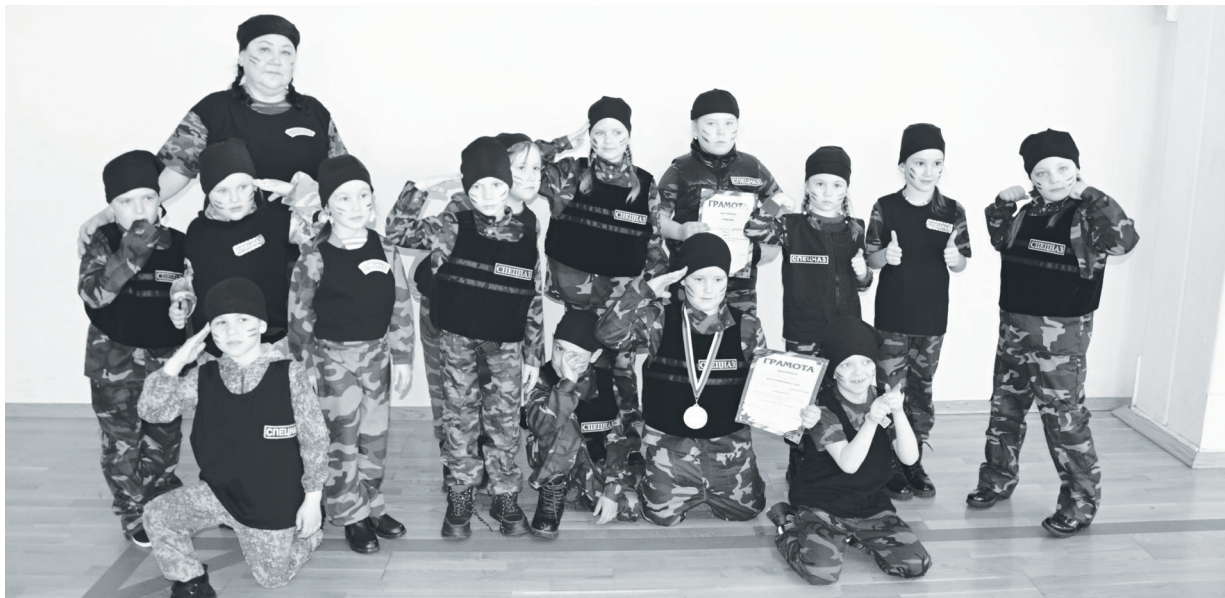
Победители смотра строя и военно-патриотической песни команда «Спецназовцев».