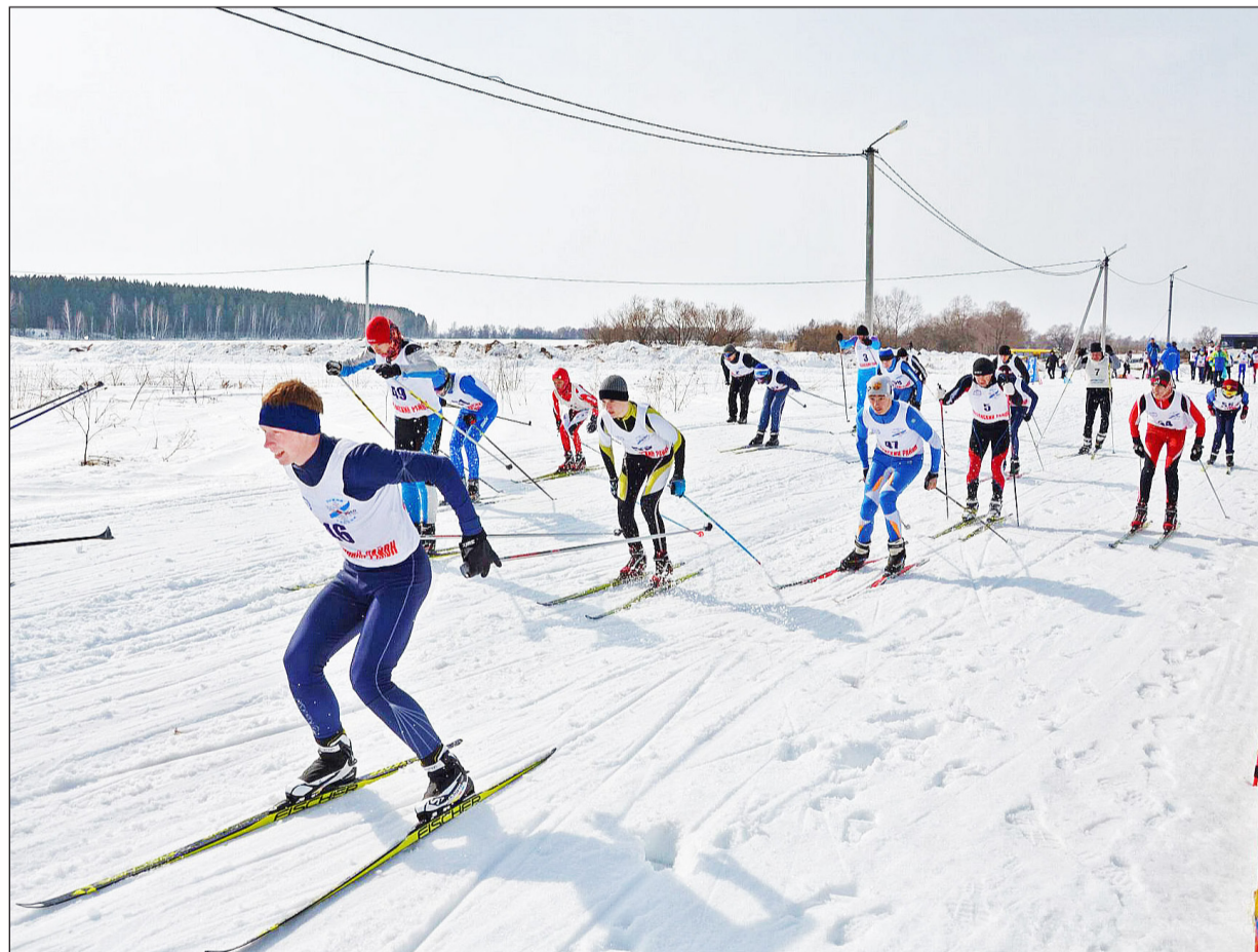
На старт вышло более ста участников соревнования

ты соревнования запечатлел наш нештатный фотокорреспондент Анатолий ЗВОНАРЁВ . Его снимки и расскажут о ходе мероприятия и достижениях спортсменов.