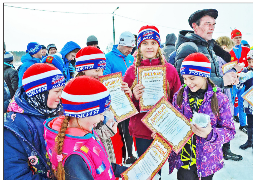
Радостно и почётно получать дипломы и признание