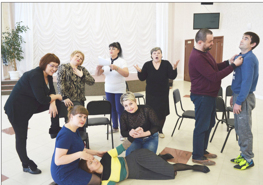
Идёт репетиция нового спектакля

– Это будет многожанровый спектакль о любви. И не только. Пусть это будет интригой для зрителей. Всех ценителей театрального искусства приглашаю в районный дом культуры на премьеру новой постановки, которая состоится совсем скоро.