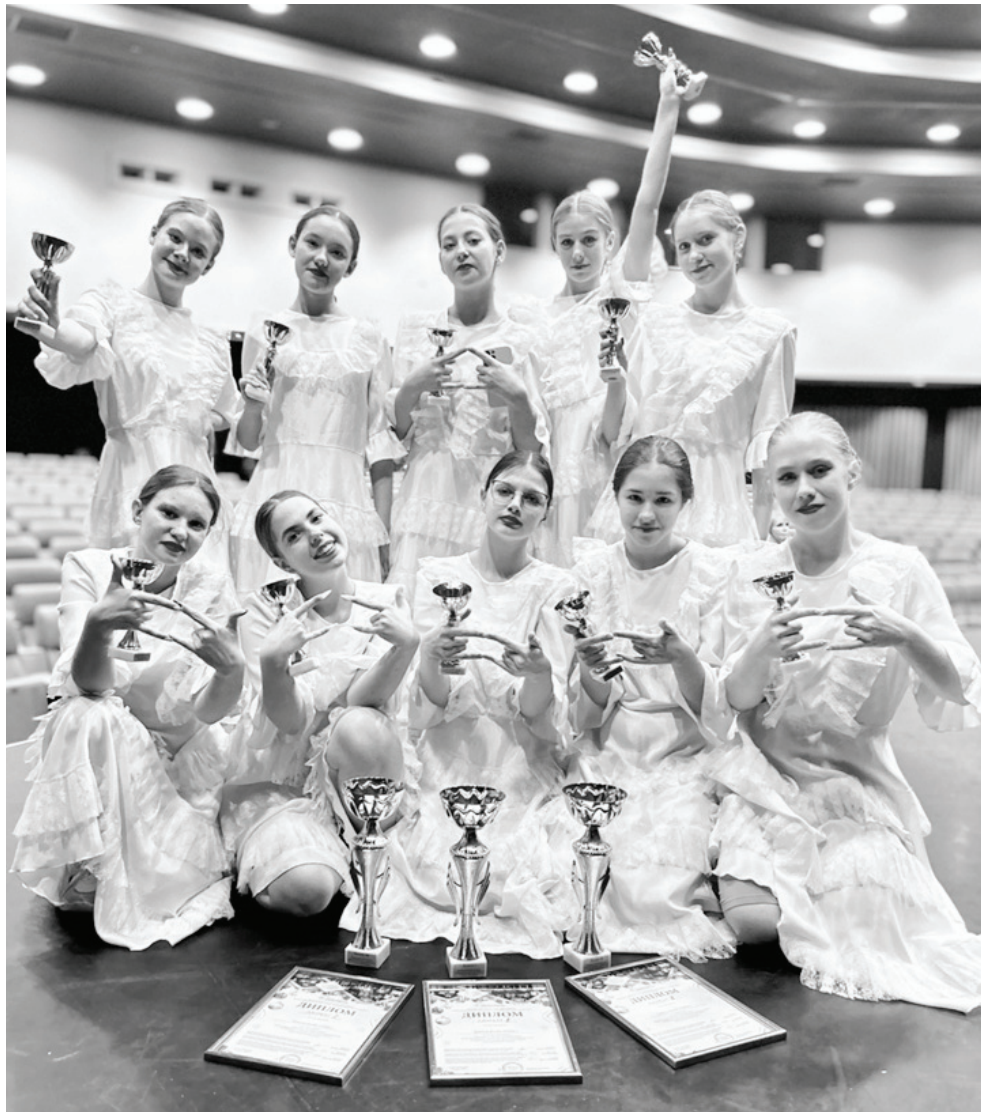
Ишимские танцоры покорили сцену Всероссийского фестиваля «Рождественские каникулы» в Санкт-Петербурге, в копилке коллектива весь комплект наград — бронза, серебро и золото.