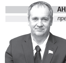
АНДРЕЙ ХОДОСЕВИЧ председатель Тобольской городской думы

Желаю всем причастным к этому празднику крепкого сибирского здоровья, тепла, благополучия и радости каждый день!