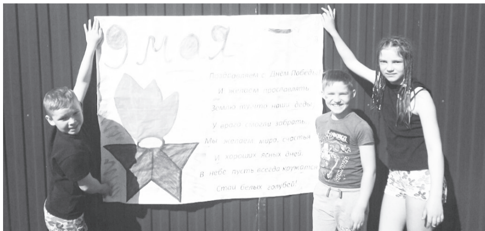
Поздравительный плакат, сделанный руками ребят, украсил ворота Трифоновых.