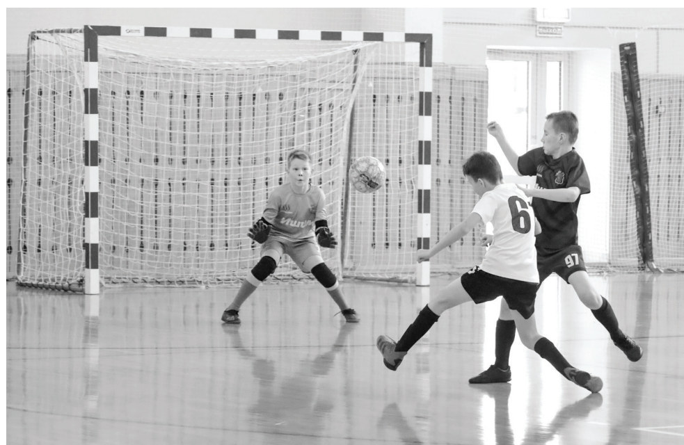
На поле мальчишки показывают настоящую борьбу, каждый пас выверен, футболисты действуют слаженно. Несмотря на юный возраст, играют все по-взрослому.

– Подняться на ступень выше и стать первыми в туре команде «Ишим-1» позволила победа в матче с «Прибрежным» из Омска. Счет 4:1, – комментирует Василий Иванович. – Отличная практика для ребят