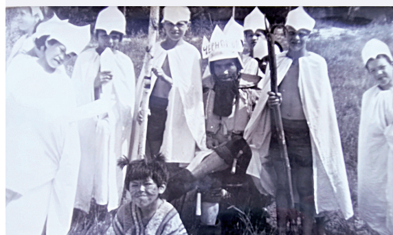
☛ День Нептуна отмечали на берегу Чёрного озера – с обязательным купанием Русалок и костюмированным представлением