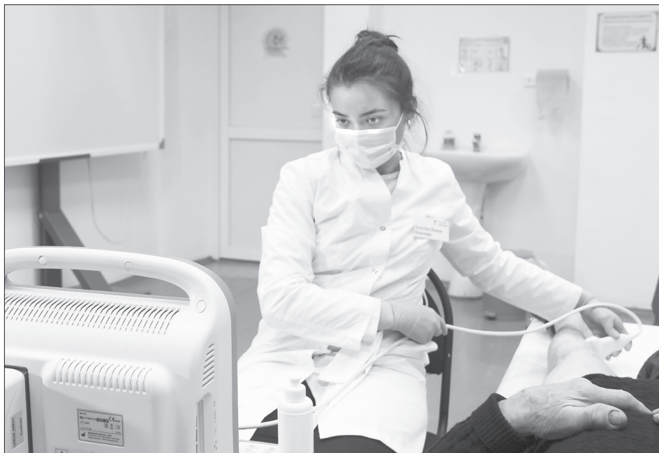
На ультразвуковом исследовании врач дополнительно сканирует болевые точки, на которые жалуются пациенты

Прямо говоря, это выезд в село диагностической экспресс-лаборатории «Здоровье и точка», которая располагается в ОБ № 23 в холле справа от входа, со всем её добрым десятком исследований, замеров и анализов. Для профилактики. Но многие хотят попасть