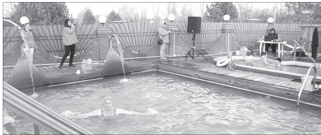
Теперь в выходные в бассейне санатория можно и искупаться, и поучаствовать в конкурсах